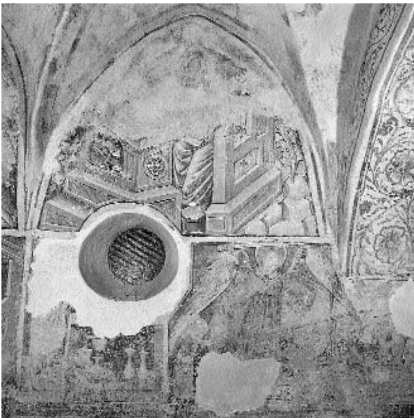
5. Velemér, c. sv. Trojice: južna stena prezbiterija. Evangelist Luka , evharistični predmeti pod okroglim oknom, na desni strani Tehtanje duš s sv. Mihaelom . Skrajno levo: del Marijine figure iz Oznanjenja

model cerkve. Slednjega v levi roki drži, z desno pa nanj kaže zaenkrat še neprepoznavna svetnica z nimbom (sl. 2, 3). V Veleméru se ni ohranila nobena druga podoba naročnika in nobenega drugega grba ne najdemo, niti tistega z belim kronanim dvoglavim orlom v rdečem polju, ki bi opozarjal na zemljiške gospode Széchy iz Veleméra. Vendar bi naročniki lahko bili tudi meščanski obrtniki, saj poznamo primer, ko so slikarji mesta Freiburg i. B. okoli leta 1320/30 tamkajšnji katedrali, ki je bila hkrati tudi župnijska cerkev, podarili okno v severni stranski ladji. Na njem najdemo že opisani grb slikarjev s sporočilnim napisom,