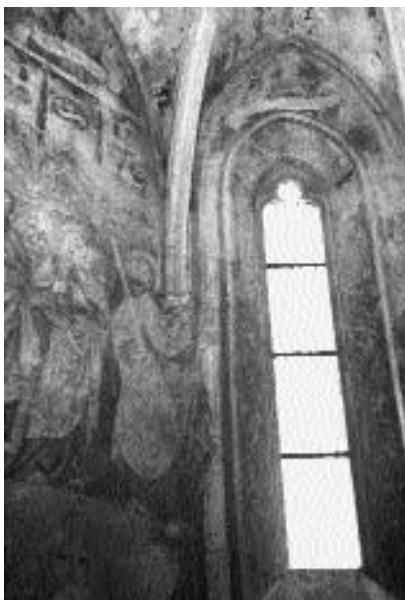
11. Martjanci, ž. c. sv. Martina: apostoli na severni steni prezbiterija