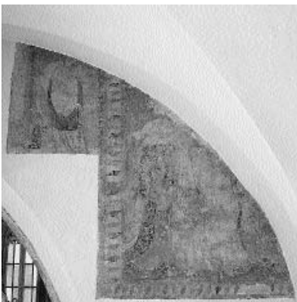
8. Martjanci, ž. c. sv. Martina: slavoločna stena, zgoraj: naročnik pred škofom, zraven: Marija zavetnica s plaščem