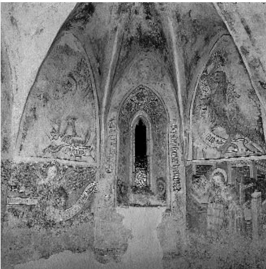
4. Velemér, c. sv. Trojice: pogled v prezbitერიj

poleg prizora Križanja na slavoločni steni, zgled takšne Caritas (sl. 6). Kaj bi torej bilo prepričljivejše kot to, da v modelu cerkve pri tehtanju duš v koru vidimo cerkvico v Veleméru in slednjo interpretiramo kot ustanovo, s pomočjo katere si je naročnik poskušal zagotoviti argument za dan, ko bo tudi njegova duša na tehtnici pri sv. Mihaelu, kar jasno ponazarja model cerkve, ki dodatno obtežuje skodelico na tehtnici. In kaj bi lahko bilo bolj logično, kot da v slikarju Janezu Aquili vidimo samega naročnika, saj je upodobljen na tako prominentnem mestu ter z vso ustrežno donatorsko ikonografijo. Pod upodobitvijo samega slikarja je namreč še enkrat naslikan enak