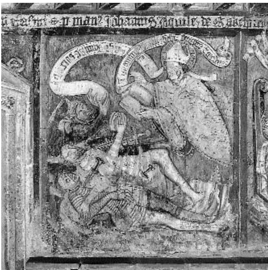
13. Martjanci, ž. c. sv. Martina: južna stena prezbiterijskega. Sv. Martin obuja tri mrtve viteze . Zgoraj del napisa o začetku gradnje

stev, s katerimi bi bilo mogoče neposredno izraziti individualnost slikarja in slikarij, je s tem vendarle narejen korak naprej v smeri, ki poudarja novi, preneseni pomen uveljavljenih ikonografskih formul predvsem z oblikovalsko izolacijo, ki meri na rešitev konkretnega pomena teh formul.