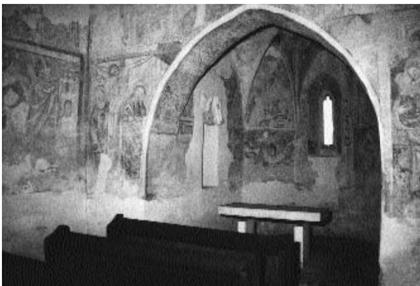
6. Velemér, c. sv. Trojice: na steni ladje: prizor s sv. Nikolajem, ki obdaruje tri revne neveste . Na slavoločni steni: Križanje , desno ob oknu v prezbiteriju: Marija , nad njo orel evangelista Janeza

vendar brez podobe naročnika. 33 Podoba slikarja kot naročnika lastne poslikave ostaja v tem primeru posebnost v 14. stoletju, pri čemer je zaznamovana le atributivno (z grbom in napisom picture ) in ne tudi situacijsko (ob slikanju ali s slikarskim priborom).