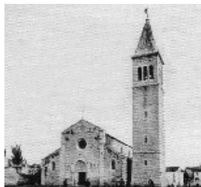
4. Zvonik i pročelje Sv. Pelagija krajem XIX. i početkom XX. stoljeća