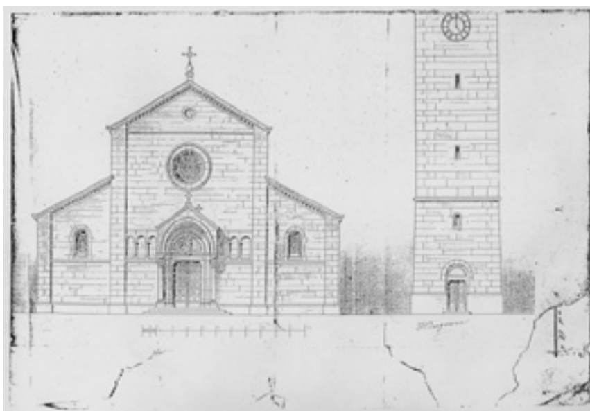
6. Nacrt H. Bergmanna iz 1880. Državni arhiv u Pazinu