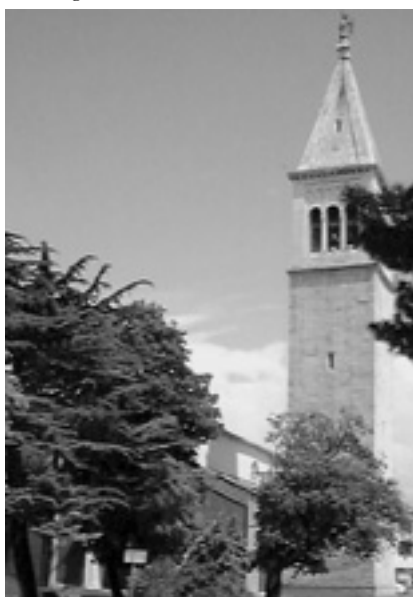
3. Zvonik i pročelje Sv. Pelagija.