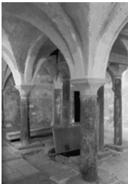
7. Novigradska kriptna nakon restauriranja.