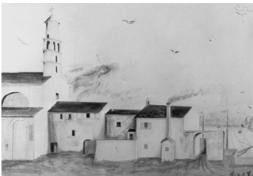
5. Crtež katedralnog kompleksa iz 1910.