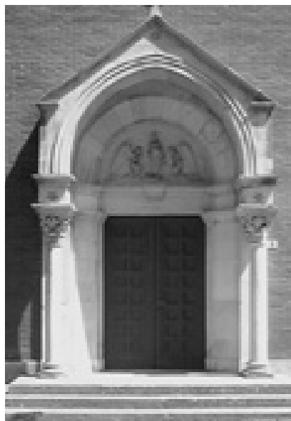
2. Zabat portala pročelja Sv. Pelagija. (Foto: K. Nemet, 2002)