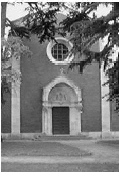
1. Pročelje crkve Sv. Pelagija u Novigradu. (Foto: K. Nemet, 2002)