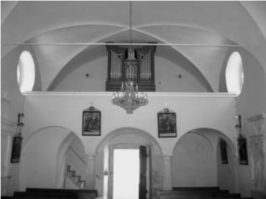
Sl. 5: p. c. sv. Ane, Slovenske Konjice, ladijski del proti zahodu

tako preprosto profilacijo kot tista na prezbiteriju. Tovrstna oblika oken je na sakralni arhitekturi v tem času na širšem geografskem območju velika posebnost, edino primerjavo pa bi lahko za enkrat našli le na ladijskem delu sočasno zgrajene nekdanje protestantske cerkve v Govčah pri Žalcu. Celotni del cerkve sv. Ane, ki izvira iz 16. stoletja, na zgornjem delu obdaja tudi zelo nenavaden venčni zidec, ki je izdelan v obliki arkadnega friza, ki sloni na geometričnih konzolah. Na zahodni steni se je pod zvonikom ohranil tudi izvorni portal, izklesan v renesančnih oblikah s stranskimi konzolnimi volutami. Na prekladi je nekoč potekal napis, ki pa je danes deloma zakrit, deloma zabrisan, zato za enkrat ni mogoče govoriti o njegovem pomenu. 9