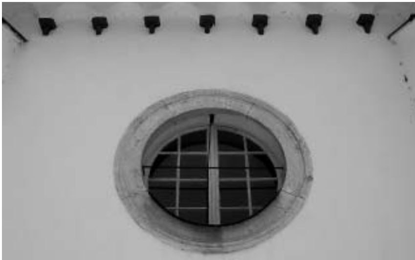
Sl. 4: p. c. sv. Ane, Slovenske Konjice, ladijsko okno z zidcem

najverjetneje uporabili tudi nekaj starejših arhitekturnih členov. 7 Na pročelju lope je vzdian grb družine Khisl (sl. 3). Južna kapela sv. Florijana in zakristija sta iz 18. stoletja, pokopališče pa so ob kapelo prestavili šele v 19. stoletju. 8