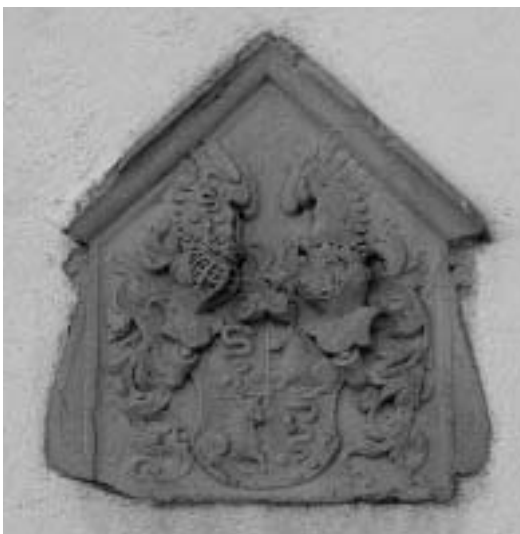
Sl. 3: p. c. sv. Ane, Slovenske Konjice, grb družine Khisl na pročelju lope

Današnja p. c. sv. Ane je glede na svojo prvotno namembnost grajske kapele sorazmerno velikih dimenzij. Z gradom jo je po legendi nekoč povezoval podzemni hodnik. 6 Prvotno je cerkev verjetno sestavljala le široka dvopolna ladja, kratek poligonalno zaključen prezbiterij in ob zahodno steno prislonjen masivni zvonik z odprto lopo v spodnjem delu. Vse stene so podprte z zunanjimi oporniki. Razširjena lopa na zahodnem delu je morda že delo 17. stoletja, ko so pri gradnji