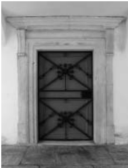
Sl. 7: p. c. sv. Ane, Slovenske Konjice, portal