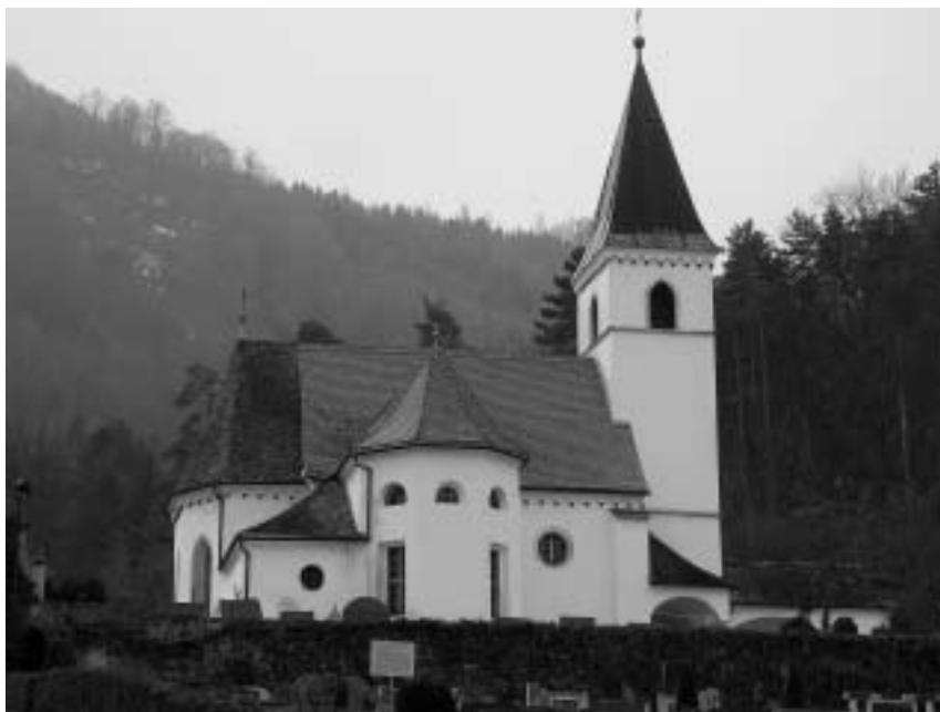
Sl. 1: p. c. sv. Ane, Slovenske Konjice, zunanjščina