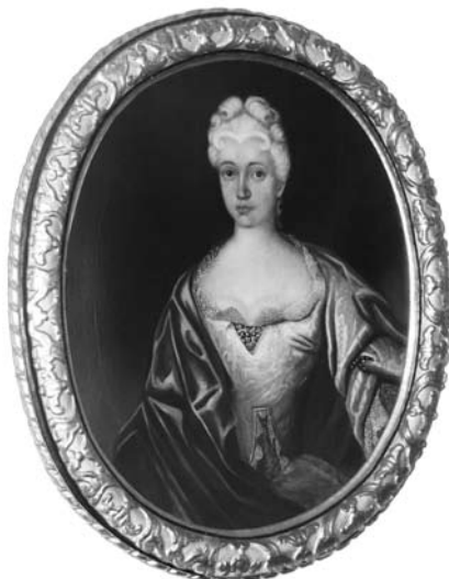
3. Neznani slikar, Portret baronice Erberg , Kranj, Gorenjski muzej (Strahlov katalog št. 416)