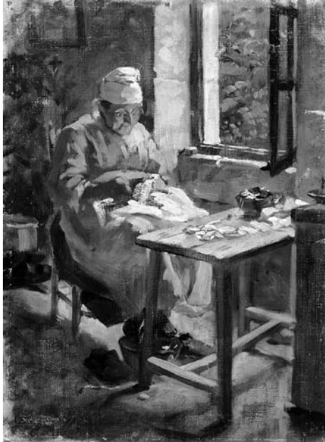
12. Jurij Šubic (?), Bretonska žena šiva pri oknu , Ljubljana, Narodna galerija (Strahlov kat. št. 276)