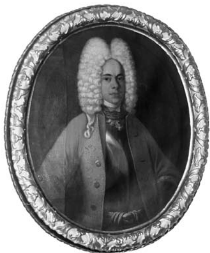
2. Neznani slikar, Portret barona Erberga , Kranj, Gorenjski muzej (Strahlov katalog št. 415)