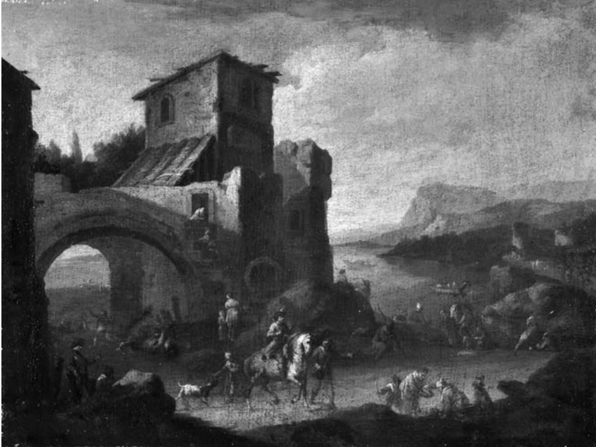
1. Neznani slikar, Krajina z arhitekturo , Ljubljana, Narodna galerija (Strahlov katalog št. 155)

getreue Tochter sta v Narodni galeriji. 43 Poleg njiju sta viseli še upodobitev samomora ( Ein Selbstmörder , verjetno Katonova smrt ) in Egiptovski Jožef, ki v ječi razlaga sanje . 44