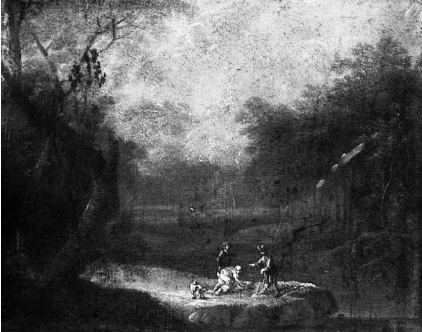
11. Neznani slikar, Krajina s skupino ljudi v ospredju , pogrešano (Strahlov kat. št. 369)

ni holandski krajini, ki ju je pripisoval Jakobu Ruysdaelu (1628–1682) oziroma njegovemu stricu Salomonu Ruysdaelu (1602–1670). 106 Eno izmed njiju, Nizozemsko gozdno krajino , je na dražbi kupil predstavnik Narodne galerije. 107 Danes je ta slika na žalost pogrešana, a se je v fototeki Narodne galerije ohranila njena fotografija (sl. 11). 108 Tako se je od štirih slik, ki jih je ljubljanska ustanova kupila na sami dražbi, ohranila le ena, Holandska zimska krajina s figuralno štafažo , slikana na pločevino, za katero je Strahl menil, da bi lahko bila delo Jana Brueghla. 109 Preostali dve sliki, ki sta bili za Narodno galerijo kupljeni