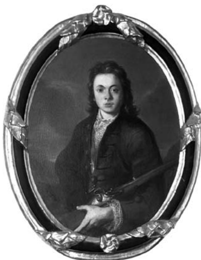
4. Neznani slikar, Portret mladega barona Erberga , Kranj, Gorenjski muzej (Strahlov katalog št. 414)