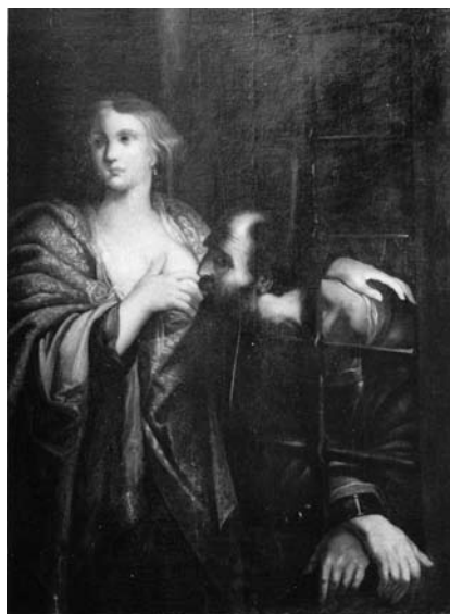
6. Caritas Romana , fotografija iz l. 1961 (Strahlov katalog št. 206)