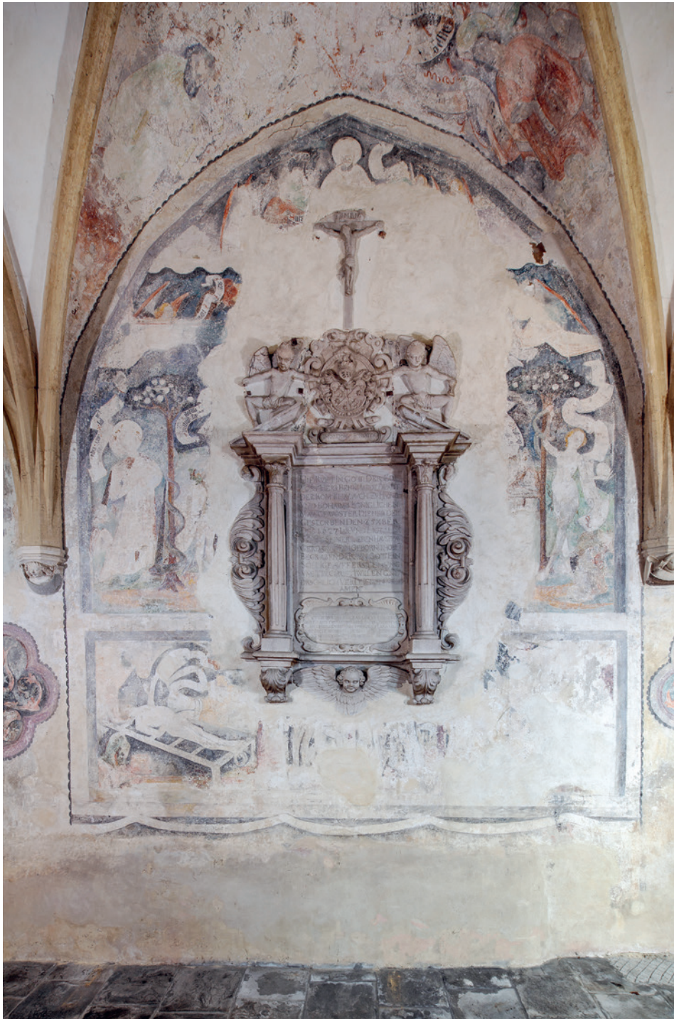
[CERKOVNIK 2] Živi križ. Ptuj, ž. c. sv. Jurija