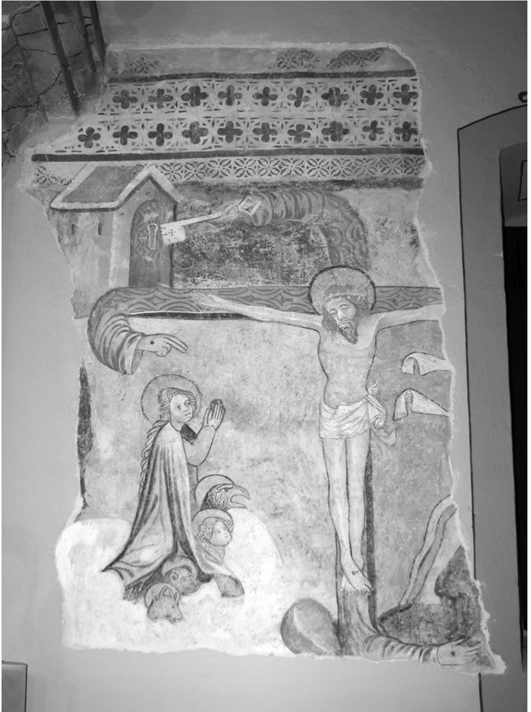
1. Živi križ. Topolšica, p. c. sv. Jakoba Starejšega