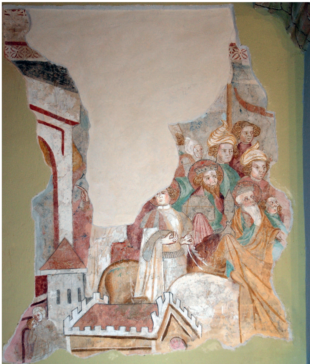
[CERKOVNIK 3] Pohod sv. Treh kraljev. Topolšica, p. c. sv. Jakoba Starejšega