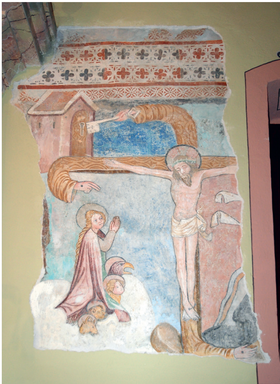
[CERKOVNIK 1] Živi križ. Topolšica, p. c. sv. Jakoba Starejšega