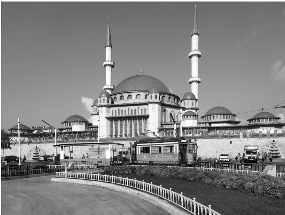
5. Pogled na mošejo s Trga Taksim, Istanbul

je zmagala sodobno zasnovana mošeja arhitekta Vedata Dalokaya (1927–1991). Gradnja se je pričela leta 1967, a se je kmalu zaključila, saj naj bi meščani protestirali proti sodobnemu arhitekturnemu videzu mošeje, zato so na istem mestu zgradili kopijo klasične osmanske mošeje, ki je bila dokončana šele leta 1987. 13 Ta dogodek so zaznamovale številne javne kritike arhitektov in umetnostnih zgodovinarjev. Najbolj znana je kritika arhitekturnega zgodovinarja Doğana Kubana (1926–2021), v kateri kritizira prakso kopiranja mošej iz 16. stoletja, ki je bila v 20. stoletju zelo pogosta. 14