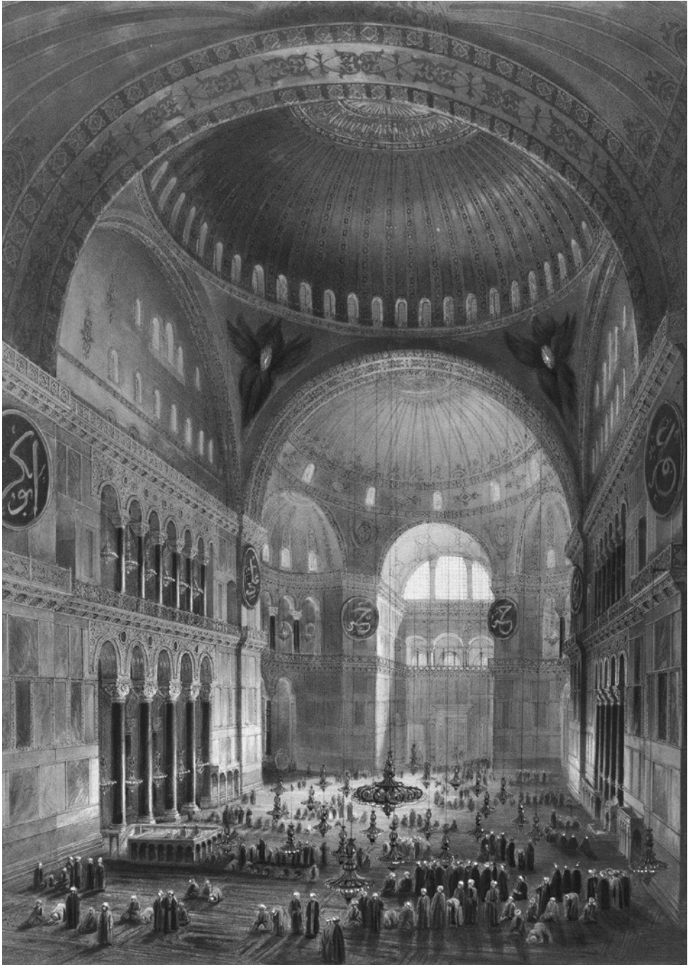
8. Gaspare Fossati, Notranjost Hagije Sofije, pogled proti vzhodu, litografija, 1852. London, Victoria and Albert Museum, SP.270:2.