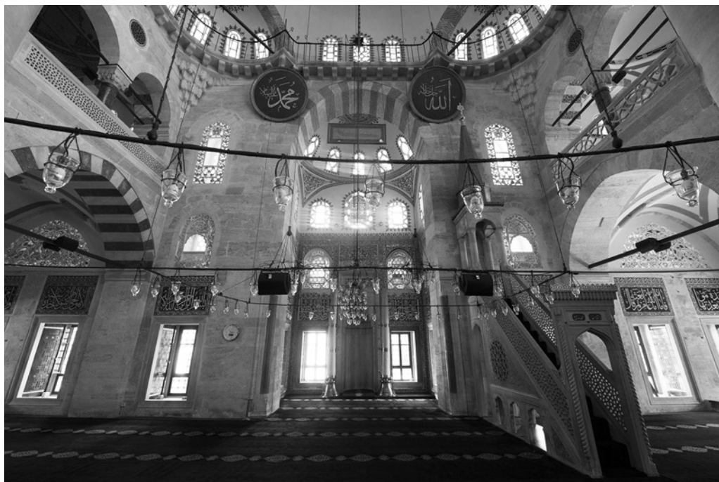
3. Mimar Sinan, Pogled proti mihrabu, mošeja Kılıç Ali Paşa, 1578–1580, Istanbul

bi morda bilo bolj primerno govoriti o mošeji Sultanahmet, ki stoji prav nasproti Hagije Sofije in je med letoma 1606 in 1617 ni zgradil Mimar Sinan temveč arhitekt Mehmet Ağa. 8 A kljub temu, ko govorimo o osmanski mošejah in njihovem arhitekturnih zgledih, prav gotovo ne gre zanemariti vpliva bizantinskih cerkva. Ta je danes morda najbolj očiten v notranjosti mošeje Kılıç Ali Paşa v Istanbulu (sl. 3, 4), ki jo je v letih 1578–1580 zgradil Mimar Sinan. Ta mošeja velja za eno od najbolj podobnih Hagiji Sofiji, vendar pa danes umetnostni zgodovinarji menijo, da so si te podobnosti želeli mecenji sami in ne arhitekt. 9 Po osmanski osvojitvi Konstantinopla leta 1453, ko je bilo v mestu le še petdeset cerkva in samostanov, 10 je bila večina cerkva spremenjenih v mošeje, kar se je zgodilo tudi s Hagijo Sofijo. A sprememba se ni zgodila čez noč, nekatere cerkve so bile spremenjene v mošeje veliko kasneje.