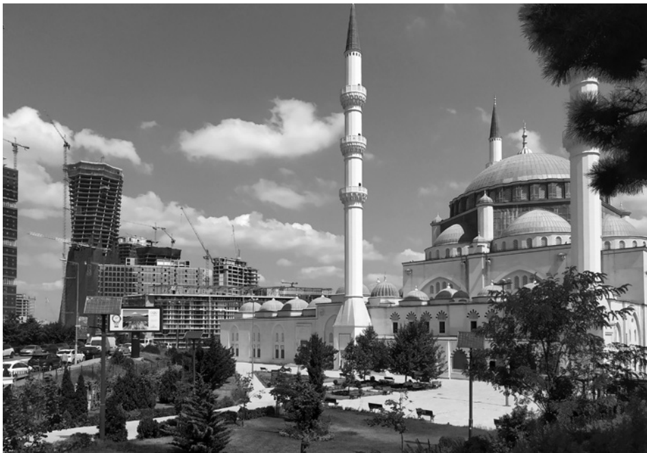
1. Zunanost mošeje Mimar Sinan, Istanbul

Hagija Sofija je gotovo imela pomemben simboličen pomen za Osmanski imperij, a istočasno se poraja tudi vprašanje, ali dandanašnji retrospektiven pogled na simboliko te cerkve morda ni napačen ali celo izkrivljen. 4 Številni miti o Hagiji Sofiji, Mimarju Sinanu, politična aktualnost te teme 5 ter zelo pogosta napaka, da o zgodovinskih pomenih sodimo skozi prizmo sedanjosti, otežujejo nepristransko sodbo. Kakšen pomen je imela Hagija Sofija za prebivalce Istanbula v 16. stoletju ali celo za samega arhitekta Sinana, morda sploh ni bistveno, vendar se ta tema še vedno pojavlja v številnih knjigah o Mimarju Sinanu. Tako se je v zgodovinospisju razširil mit, ki je živ še danes in se celo pojavlja v umetnostnozgodovinski literaturi. Mit pravi, da naj bi bila Hagija Sofija za Mimarja Sinana najprej zgled za njegove mošeje, a da je sam želel zgraditi večje in boljše zgradbe, ter celo, da je s svojo