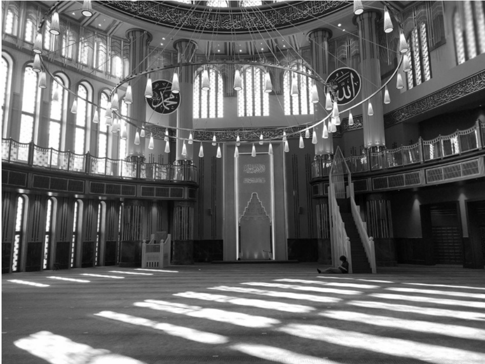
6. Notranjost mošeje na Trgu Taksim, Istanbul

rišejo vzporednice med neosmanskim slogom v arhitekturi in vladajočo politično stranko AKP, ki je na oblasti že skoraj dvajset let. Nekateri menijo, da sta glavna razloga za neosmanski slog dva: po eni strani se želi s tem slogom okrepiti spoštovanje do vere in občutek predanosti, drugi pa naj bi bil bolj političen, in sicer naj bi vladajoča stranka s tem kazala svojo moč. 15 Vendar odgovor na to vprašanje morda le ni tako preprost. Mošeja na trgu Taksim, 16 ki je bila dokončana 28. maja 2021, se ponovno in bolj neposredno navezuje na Hagijo Sofijo.