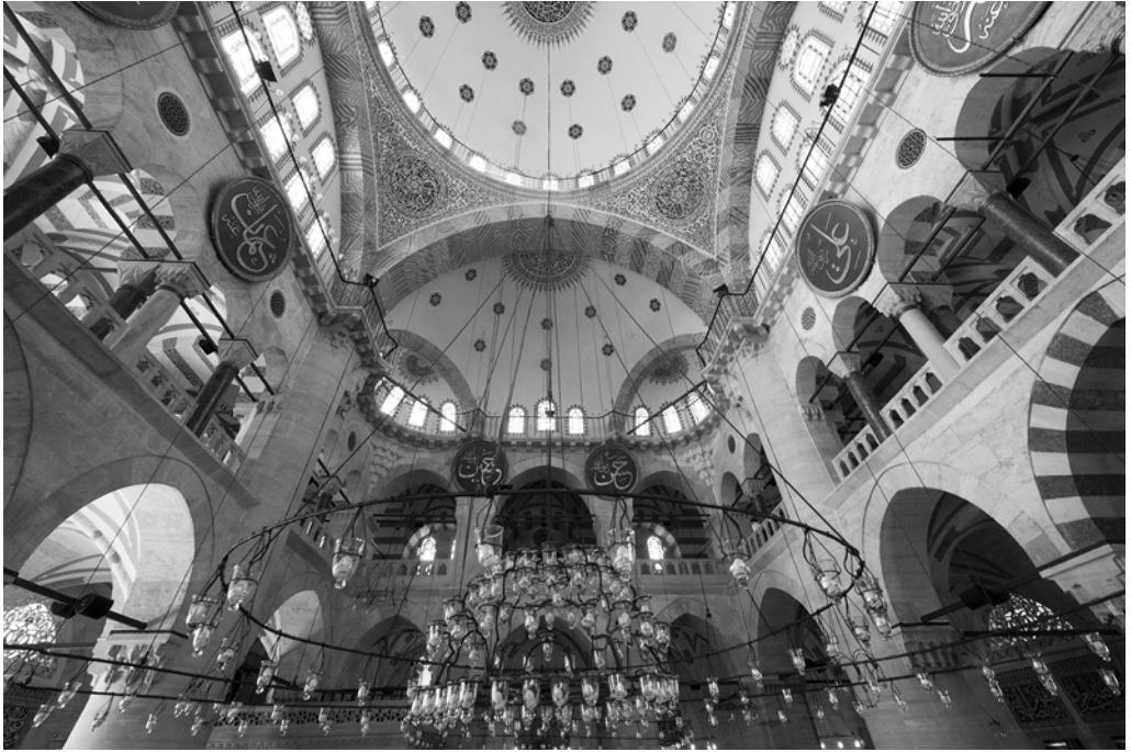
4. Mimar Sinan, Pogled proti zgornjemu nadstropju mošeje Kılıç Ali Paşa, 1578–1580, Istanbul

si je novonastala republika pod vodstvom Mustafe Kemala Atatürka prizadevala prekiniti vezi z Islamom in Osmanskim imperijem in »ustvariti« novo narodno in zgodovinsko identiteto. Za to je bila, med drugim, za prestolnico nove države izbrana Ankara, saj je bil Istanbul, prestolnica Osmanskega imperija in muslimanskega kalifata, preveč povezan z zgodovino. 11 Tako se je začela urbanistična in arhitekturna prenova Ankare, a zdi se, da je arhitekturna prenova države uspela le delno, saj v sakralni arhitekturi ni prišlo do večjih sprememb. Pri gradnji mošej je še vedno, z redkimi izjemami, prevladoval klasični osmanski tip, ki ga je razvil Mimar Sinan. Kljub številnim kritikam arhitektov in arhitekturnih zgodovinarjev, so v 20. stoletju slabe in dobre kopije klasičnih osmanskih mošej iz 16. stoletja še naprej prevladovale. Eden izmed najodmevnejših dogodkov, ki bi to lahko spremenil, je bilo tekmovanje za eno največjih mošej v Ankari, mošejo Kocatepe. To je bil prvi urbanistični razpis v republiki, ki je vključeval tudi mošejo. 12 Na razpisu