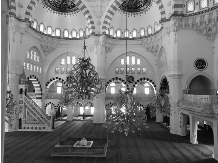
2. Notranjost mošeje Mimar Sinan, Istanbul

arhitekturo simbolično izzval tisoč let starejšo zgradbo. 6 Med klasično osmansko mošejo in Hagijo Sofijo res lahko najdemo nekaj skupnih točk, a trditve nekaterih umetnostnih zgodovinarjev, češ da so osmanske mošeje le variacije Justinijanove Hagije Sofije, so pretirane. 7 Če govorimo o arhitekturnem izzivanju Hagije Sofije,