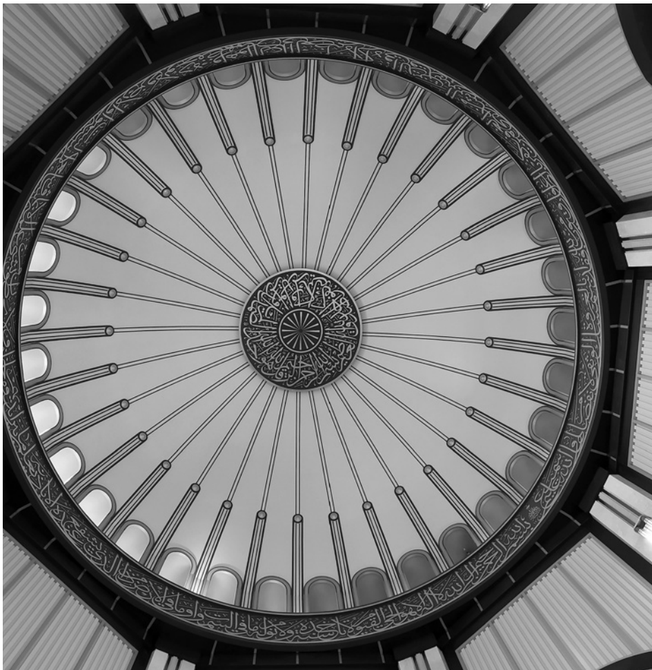
9. Kupola nad vhodom v mošejo Taksim

začetku 20. stoletja so tu živeli pretežno tujci, zahodnjaki. Še danes je tu večina tujih konzulatov. Zaradi pretežno tuje in tudi krščanske populacije v tej mestni četrti, mestne silhuete ne zaznamujejo minareti, so pa tu številne cerkve, a pogosto skrite med stanovanjske zgradbe. V neposredni bližini trga Taksim je grška ortodoksna cerkev Sv. Trojice, ki z zvoniki izstopa iz mestnega tkiva. Prav to, da na trgu izstopa simbol druge vere, naj bi bil eden izmed razlogov za gradnjo mošeje na tem mestu. 18