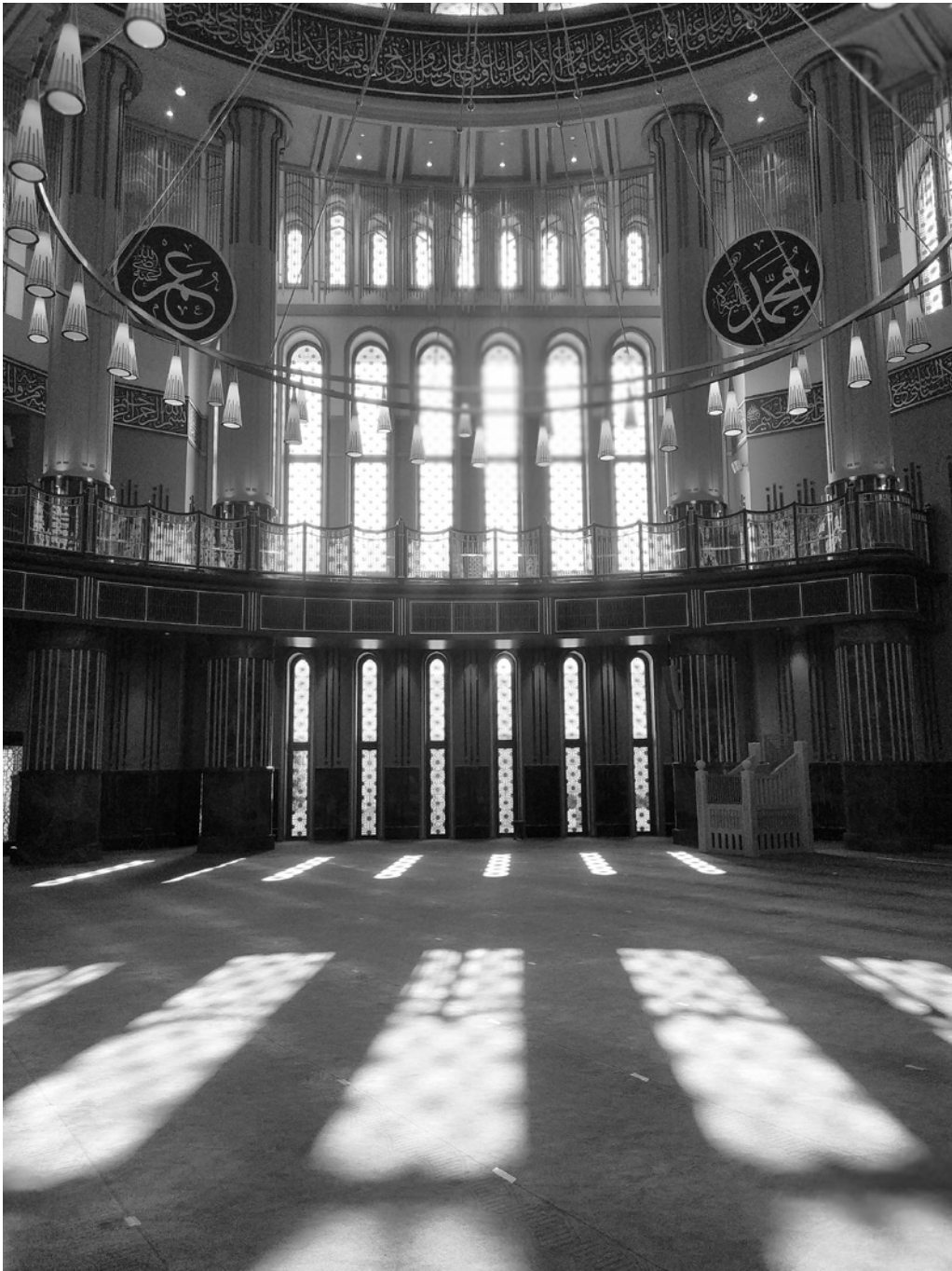
7. Notranjost mošeje na Trgu Taksim, Istanbul