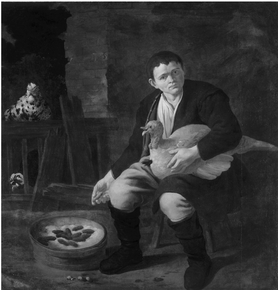
6. Joannes Almenak, Deček s puranom, olje/platno, 150.5 x 155 cm. Ljubljana, Narodna galerija

postavljajo okvirni čas Almenakovega delovanja na Kranjskem v zgodnja osemdeseta leta 17. stoletja. 14