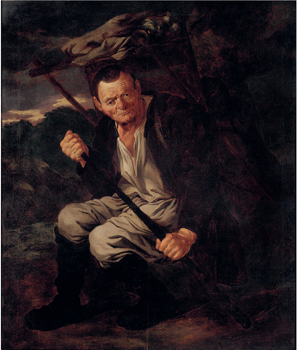
[LUBEJ 7] Joannes Almenak, Gorenjski Krošnjar, olje/platno, 148.5 x 125 cm. Ljubljana, Narodna galerija