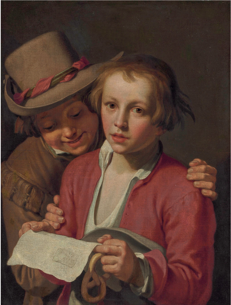
[LUBEJ 9] Abraham Bloemaert, Pojoča dečka, olje/platno, 67,9 x 52,4 cm. Christie's-New York (31-I-2013, lot 252)