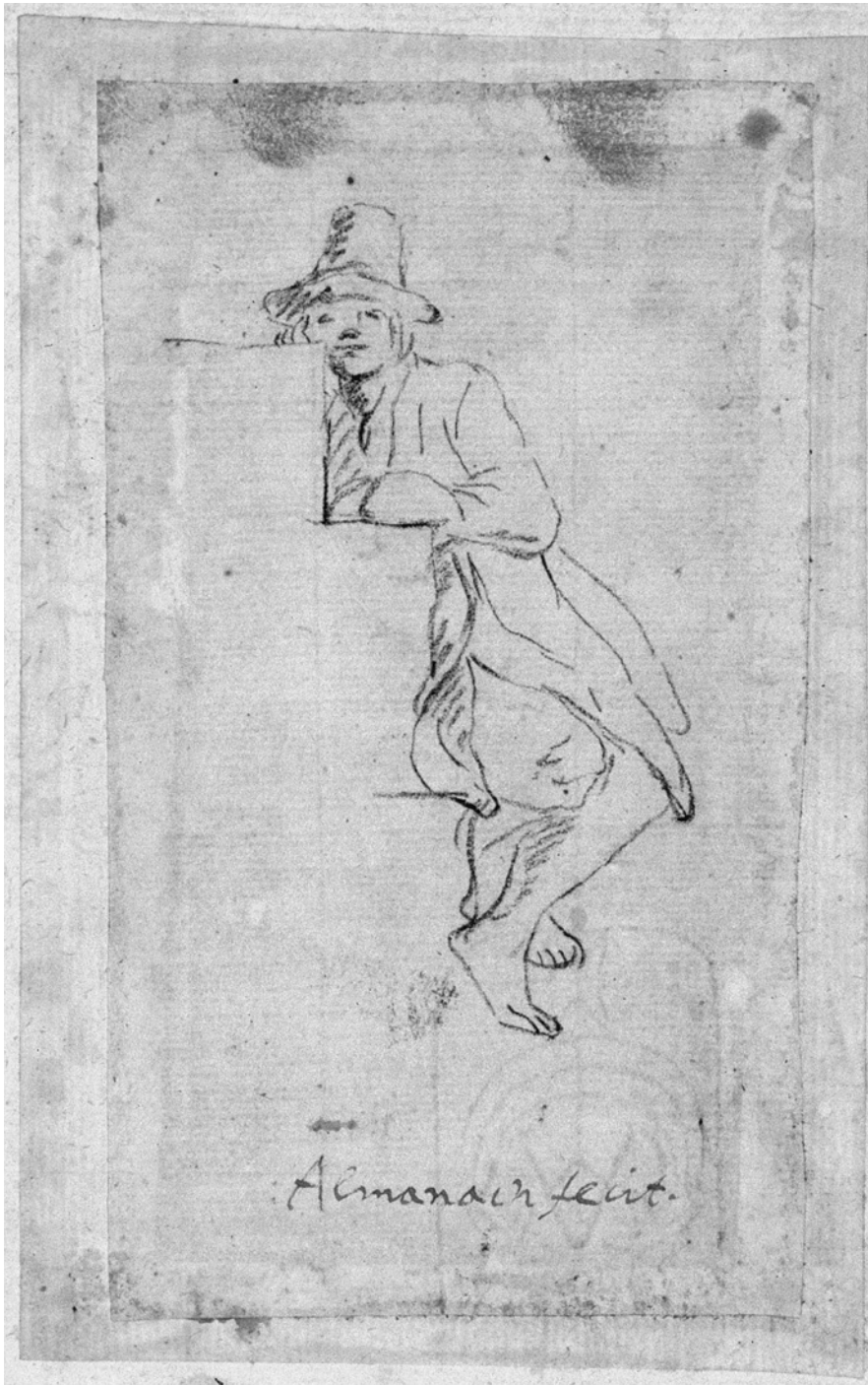
1. Joannes Almenak, Sedeći mladenič, risba, črn svinčnik, inskr. (Valvasor): Almanach fecit, 133 x 77 mm. Zagreb, Metropolitanska knjižnica, Hrvatski državni arhiv