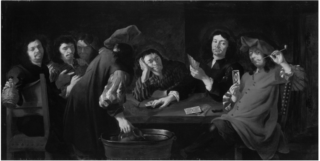
5. Joannes Almenak, Kvartopirci II., olje/platno, 147 x 285 cm. Ljubljana Narodna galerija

zu dvorca Bokalce opazimo, da je dokumentirano stanje objekta brez dveh oktogonálnih stolpov, torej pred prenovo, na katero se je lastnik pripravljaj z nakupi opek že od leta 1676 dalje, zato bi lahko zaključek gradbenih del postavili v čas okoli 1680, vsekakor kmalu po izidu Topografije , kajti v Valvasorjevi Slavi iz leta 1689 že najdemo grafiko prenovljenega dvorca pa tudi omembo Almenakovih slik v njem. 12 Nastanek Almenakove risbe Grad Bogenšperk , ki močno presega kvaliteto predložne risbe, uporabljene za grafični prevod in objavo v Topografiji , lahko postavimo v čas po marcu 1679 in pred koncem leta 1681, ko je eden najvidnejših sodelavcev Valvasorjeve grafične delavnice na Bogenšperku, utrechtški grafik in slikar Justus van der Nypoort (ok. 1645/49–po 1698), avtor naknadno izrisanega drevesa v prostorskem odrivalu te Almenakove risbe, zapustil Kranjsko in odšel iskat nove izzive na Dunaj. Zadnji indic za datiranje Almenakovih risb v čas okoli leta 1680 je vodni znak papirja, na katerem je skiciral Sedečega mladeniča , kajti deželni slikar Ludvik de Clerick je leta 1679 svojo predložno risbo orla iz grba vojvodine Kranjske izrisal na papir z enakim vodnim znakom. 13 Vsi navedeni indici