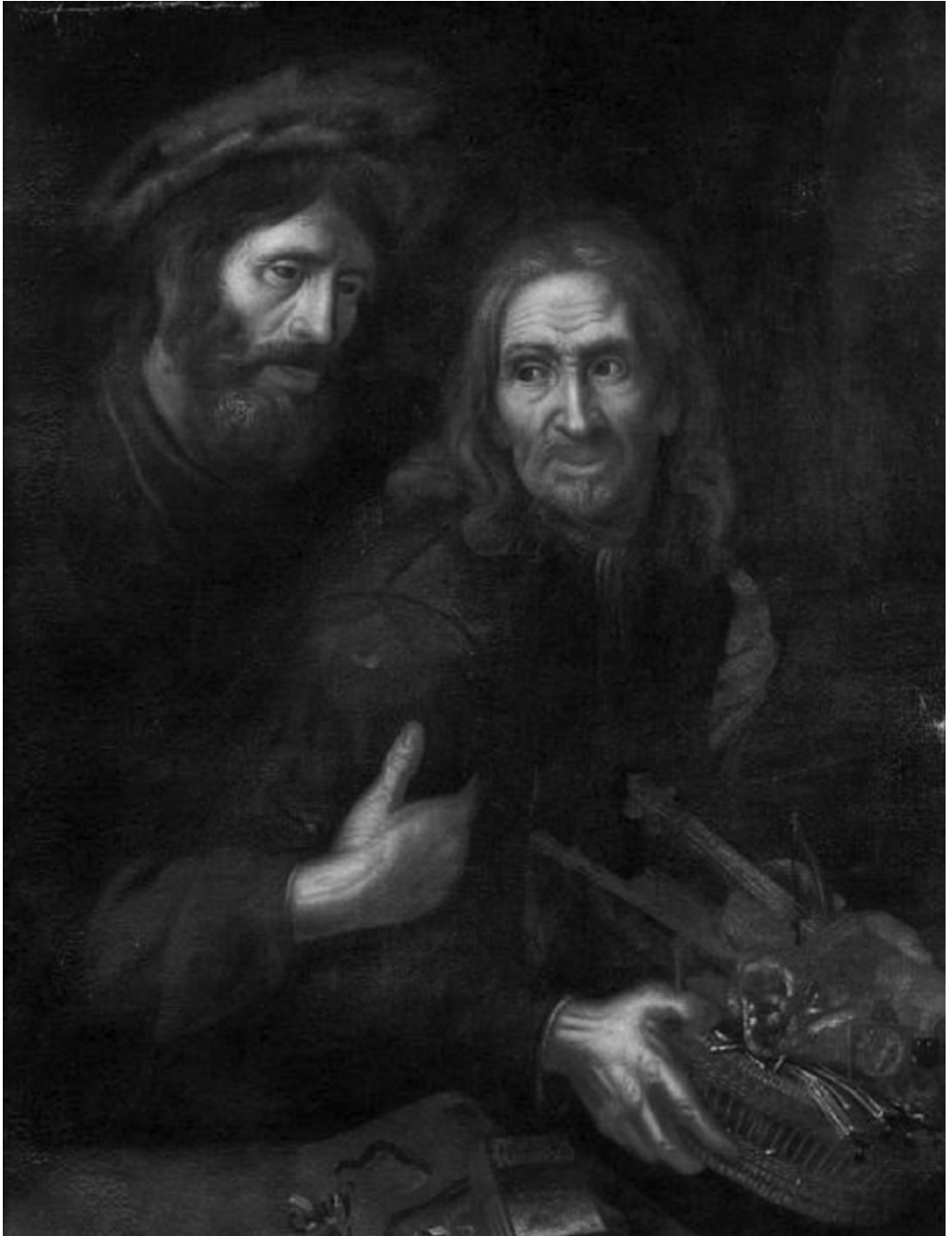
8 Joannes Almenak, Potujoča muzikanta, olje/platno, 106 x 88 cm. Neznano nahajališče (Millon-Paris, 17-XII-2017, Lot 59)