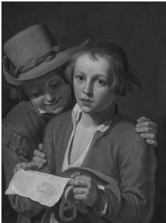
9 Abraham Bloemaert, Pojoča dečka, olje/platno, 67,9 x 52,4 cm. Christie's-New York (31-I-2013, lot 252)

leta 1624. 17 V ilustraciji emblema dve roki vlečeta presto vsaksebi, kar ponazarja človeka, stoječega sredi boja med dobrim in zlom. Sporočilo besedila pod ilustracijo pa vsebuje namig na to, da človeka v življenjskih preizkušnjah ne bo zdrobila povezanost v mislih in dejanjih (Složnost, Concordia ) in obrzdanost v minljivih užitkih in materialnih dobrinah, temveč nerazsodno prepuščanje fizični in čutni razpuščenosti. Cela presta ima zato pozitivni simbolni pomen označevalca dejanj povezovanja in brzdanja poželenj. V žanrskem slikarstvu je negativni pomen zlomljene preste prisoten zlasti v gostilniških prizorih veselic in preteпов pa tudi pri temi »razpuščeno gospodinjstvo«, na primer na sliki Jana Steena (1626–1679) Pazljivo s poželenji iz leta 1663. 18