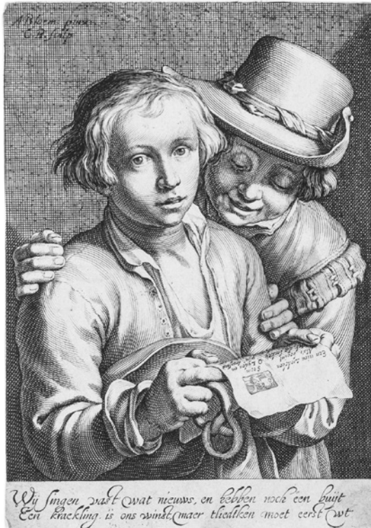
10 Cornelis Bloemaert (po Abrahamu Bloemaertu), Pojoča dečka, bakrorez

Slikar je v levi del prostora, polnega kaotično razpostavljenih predmetov in živali, umestil starko, ki jo je med opravljanjem dela premagal spanec, v ozadju pa se dečka in deklica predajajo raznim čutnim omamam. Sredi prizora sedi lepa mladenka in z roko poželjivo sega med nogi lagodno zleknjenega moža. V ozadju, kot protiutež barviti razposajenosti celotnega gospodinjstva v prostoru, stojita v črnino odeti postavi kvekerja in redovnice, povezana v pozivu k čuječnosti z branjem in dvignjenim kazalcem roke. Slikar je očitno dobro poznal oba pomena simbola in ju zato nazorno umestil na tla prostora – odlomljen kos preste natančno pod poželjivo roko zapeljivke in celo presto pod žugajočo roko redovnice. Celo presto in podoben objem povezanosti kakor v Almenakovi sliki Potujoča muzikanta opazimo tudi v prizoru dveh mladih pevcev na sliki Abrahama Bloemaerta (1566–1651) Pojoča dečka iz ok. 1625. 19 Abrahamov sin Cornelis Bloemaert (1603–1692) je zrcalni grafični prevod te slike dopolnil s pomenljivim besedilom o presti, ki ni le nagrada za opravljeno delo, temveč tudi nagrada za obrzdanost dveh harmonično