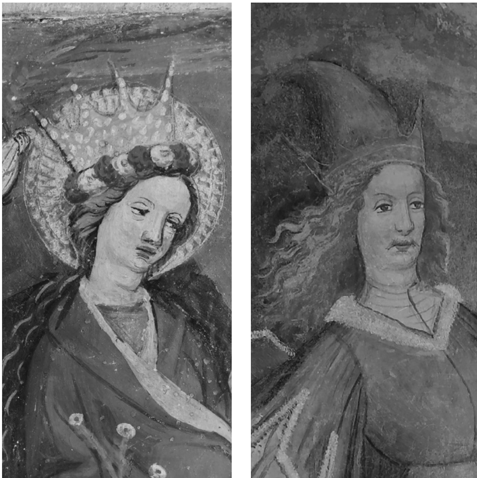
7. Detajla sv. Doroteje (Liemberg) ter mladega kralja (Žabnice)

ter jo datiramo proti sredini 15. stoletja. Mučeništvo desetisočih in Pokol nedolžnih se slogovno rahlo razlikujeta od ostalih žabniških prizorov in sta pripisljiva Janezu Ljubljanskemu. V povezavi s cerkvico sv. Doroteje pa se odpirajo nadaljnja vprašanja, zlasti glede njene namembnosti in pomena tekom stoletij. Arhitektura z močnimi zunanji oporniki in več plasti poslikav, med njimi zelo kakovostna beljaška, namreč namigujejo, da cerkev svoj čas ni bila le preprosta podružnica.