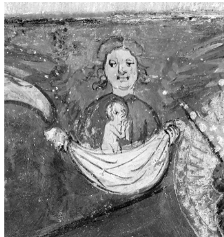
6. Primerjava obrazov Križanega (Sv. Gandolf), mučenca (Žabnice) ter angelov (Žabnice, Liemberg)

kril. V Liembergu je še ena obema poslikavama skupna točka, na enak način sta zastavljena obraza najmlajšega kralja v Žabnicah in sv. Doroteje v Liembergu (sl. 7).