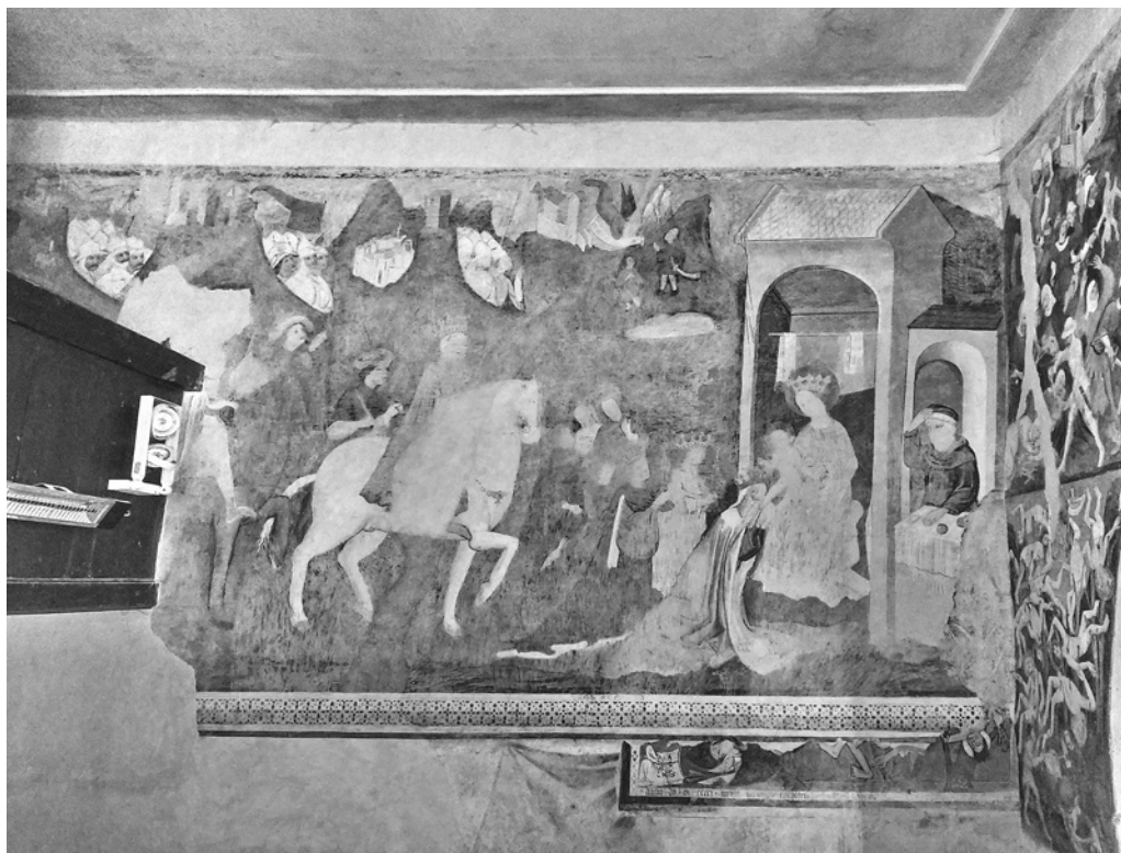
2. Poslikava severne ladijske stene. Žabnice, c. sv. Doroteje

treh kraljev . Prične se v levem zgornjem kotu, za ogled podrobnosti pa se je treba povzpeti na pevski kor (sl. 3). Tu vidimo začetek dogajanja – pred obzidjem Jeruzalema se najmlajši kralj na konju s stiskom roke poslavlja od kralja Heroda in se priključuje sprevodu pred seboj, ki je slabo ohranjen, mestoma tudi uničen. Celotni steni je skupno krajinsko ozadje z mesteci in utrdбами. Iz ozkih dolin v ozadju se trikraljevskemu sprevodu približujejo skupine vojakov. Proti desni v ozadju vidimo prizor Oznanjenja pastirjem , ki se dogaja ob jezercu, v prvem planu pa so sveti trije kralji že pred Jezusom. Najstarejši ga je že obdaril ter mu poljublja nogo, 19 druga dva pa še držita svoji darili. Marija z Jezuščkom je žal ohranjena bolj kot ne v silhueti, ob strani je tudi sv. Jožef. Freska je od zahoda proti vzhodu vedno slabše ohranjena, zares dobro je ohranjen le del dogajanja, viden na pevskem koru, delno pa še figuri klečečega najstarejšega kralja in Jožefa.