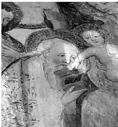
5. Primerjava obrazov sv. Boštjana (Žabnice), sv. Jožefa (Žabnice), klečečega kralja (Žabnice) ter klečečega kralja (Sv. Gandolf)

hodi mladenka. Ujemata se tudi spačen obraz Križanega v Sv. Gandolfu ter mučencev iz žabniškega Mučeništva desetisočih (sl. 6).