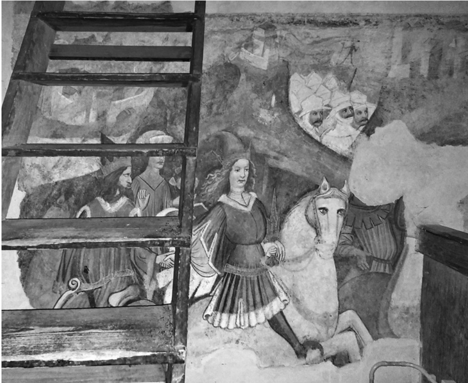
3. Najbolje ohranjeni del poslikave na pevskem koru. Žabnice, c. sv. Doroteje

Poslikava se nadaljuje na ladijski strani slavoločne stene (sl. 1, 4). Del stene na severni strani slavoločne odprtine je horizontalno razdeljen na dva prizora. Na spodnjem je upodobljena množica moških, ki goli (z izjemo opasic) trpijo mučeniško smrt, nataktnjeni na velike zelene trne oziroma ostre veje, ki prebadajo njihova telesa. Telesa mučencev so krvava, groteskno zvita, obrnjena v vse smeri ter večkrat prebodena. Prizor predstavlja Mučeništvo desetisočih , zgodbo iz legende o sv. Ahaciju, 20 rimskemu častniku, ki je s svojo vojsko prestopil v krščanstvo. Na zgornjem delu prizora je eden izmed mučenih ločen od množice tako, da nosi belo oblačilo, zgornji del figure pa žal ni ohranjen. 21 To bi bil lahko sam sv. Ahacij. Ob