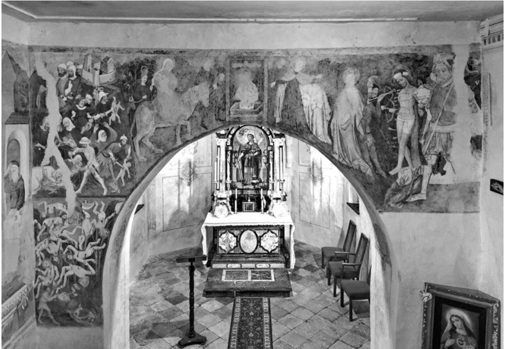
1. Cerkev sv. Doroteje v Žabnicah, notranjščina proti vzhodu

znani podatki o njej niso popolnoma zanesljivi. Najverjetneje majhna vaška cerkva nekdanje ni pritegnila prav veliko pozornosti raziskovalcev, saj od daleč ni bila videti nič kaj posebnega, njene stene pa je tako na zunanjščini kot v notranjščini prekrivala nepriljubljena rumena barva. Danes je videti popolnoma drugače, saj je po zaslugi restavratorskih posegov na zunanjščini (2019) 16 prišla do izraza njena arhitektura, že leta 2013 pa so v notranjščini našli tudi freske. Tako lahko po zaslugi pravkar zaključenih konservatorskih posegov (2018–2019, 2020–2021) danes občudujemo tudi slikarski okras cerkvice sv. Doroteje. 17