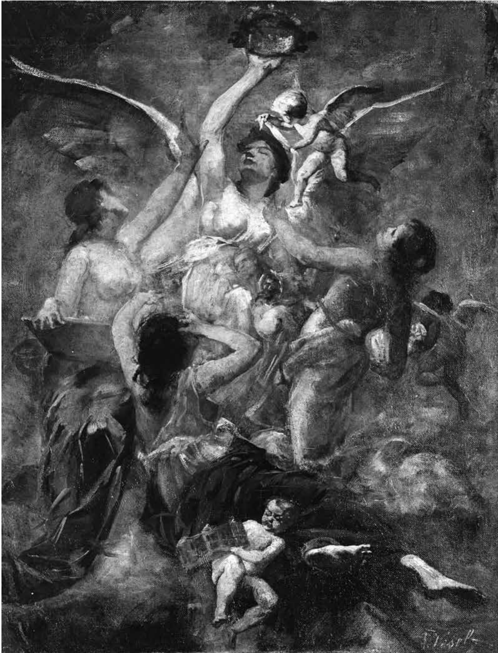
5. Ferdo Vesel, Alegorija Umetnosti, 1891, 56,5 x 44 cm, olje na platnu. Zasebna last