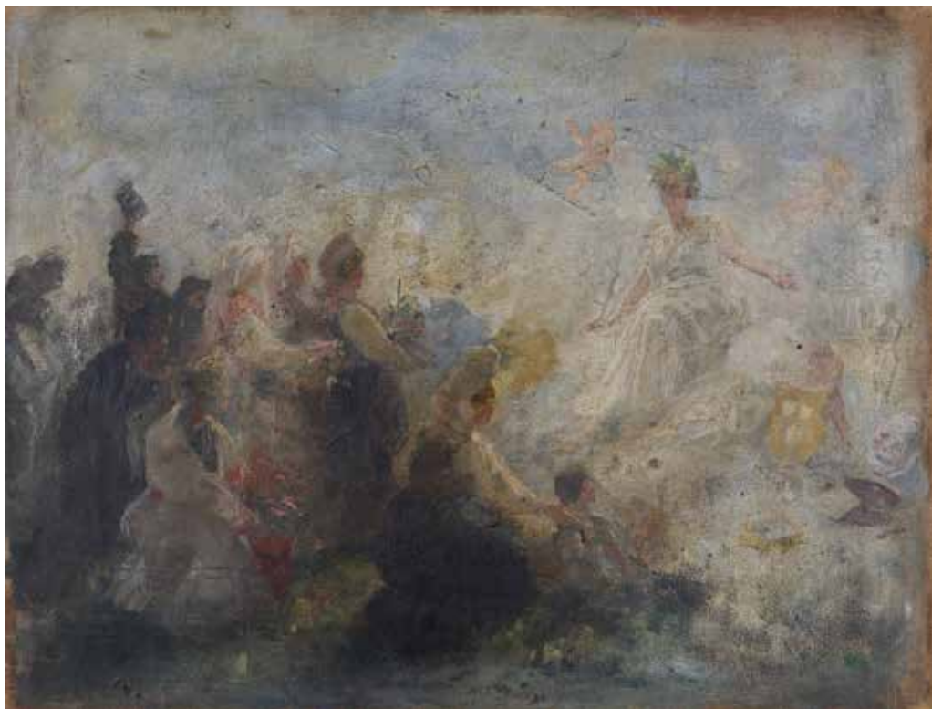
[VALANT 6] Ferdo Vesel, Načrt za zastor Kranjska se klanja Umetnosti, 1891, 41 × 54 cm, olje na platnu. Zasebna last