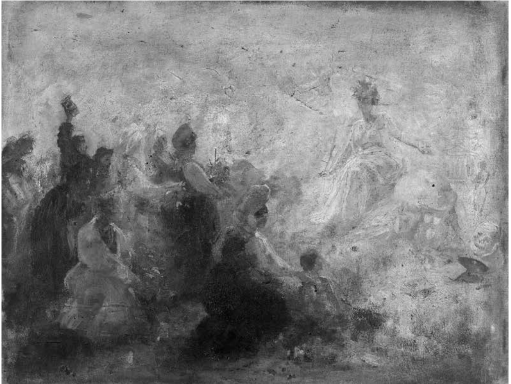
6. Ferdo Vesel, Načrt za zastor Kranjska se klanja Umetnosti, 1891, 41 × 54 cm, olje na platnu. Zasebna last

ca in oblikoval kompozicijo, ki nacionalne identitete ne razume več kot dekorativni dodatek, temveč jo vgradi v samo jedro ikonografskega pomena.