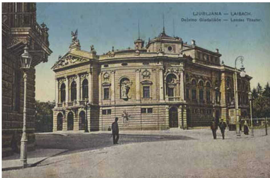
[VALANT 3] Razglednica z motivom Deželnega gledališča v Ljubljani