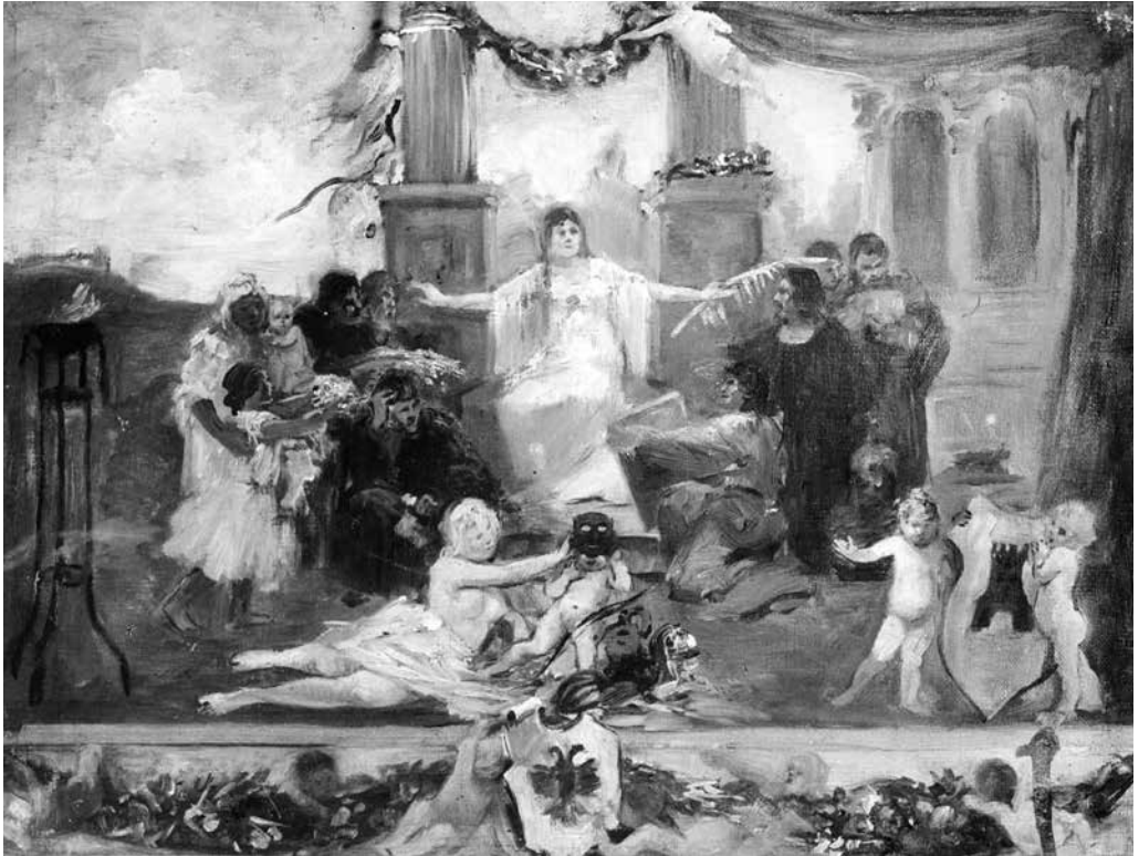
4. Alojz Šubic, Skica za zastor Deželnega gledališča v Ljubljani, 1891, olje na platnu, 35,5 × 46 cm. Ljubljana, Narodna galerija, NG S 413

Temu opisu ustreza tudi Šubičeva skica, s preprosto in razumljivo ikonografijo. Njeno vizualno besedišče je polno elementov, značilnih za velike dekorativne projekte v tedanji Avstriji, ki jih zaznamujejo personifikacije, alegorije in izrazita želja po reprezentativnosti. Kompozicija razkriva očitno podobnost s Hynaisovim zastorom za Češko narodno gledališče v Pragi (1883; sl. 2), eno najbolj znanih umetnin tega tipa. Alojz Šubic je ta vzor zagotovo poznal, morda tudi prek svojega brata Janeza. 69