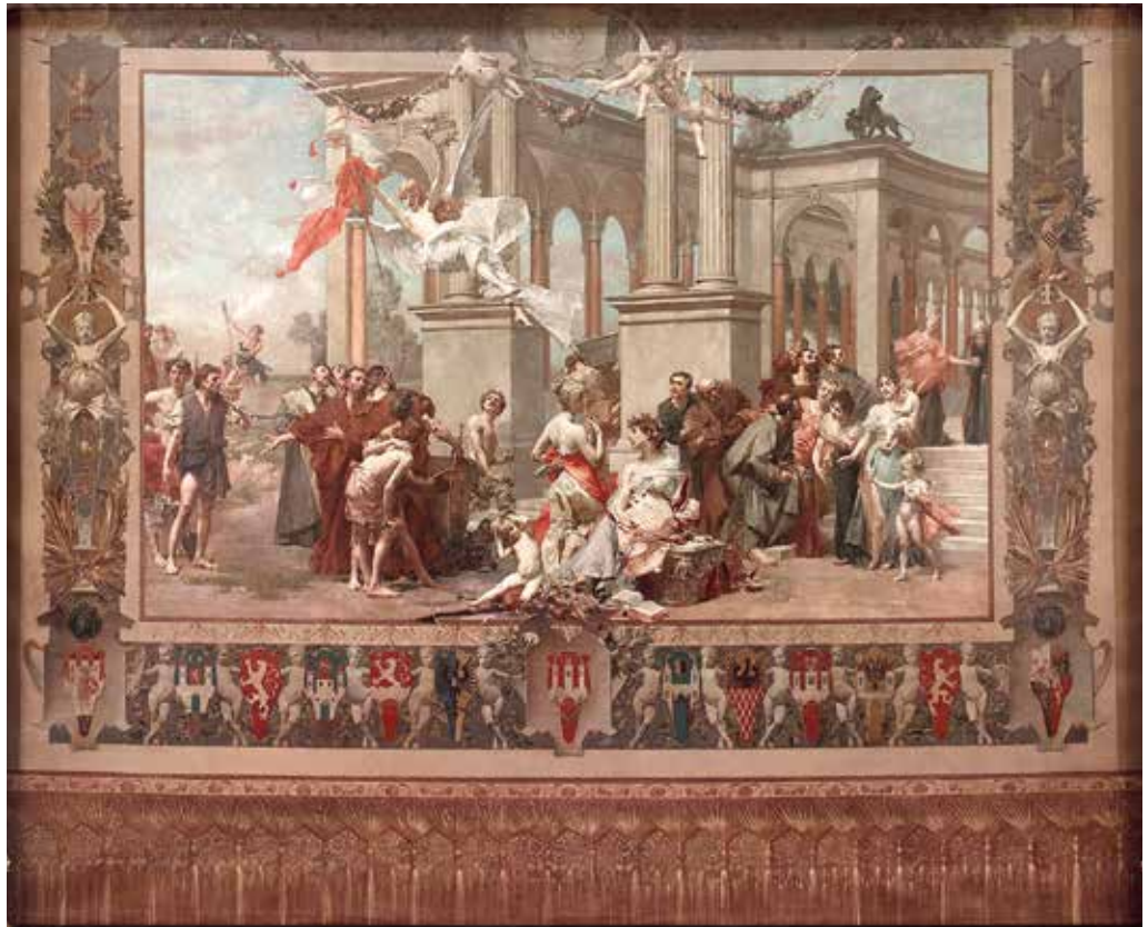
[VALANT 2] Vojtěch Hynais, Zastor Češkega narodnega gledališča, 1883, olje na platnu, 11 × 12, 5 m. Praga, Češko narodno gledališče