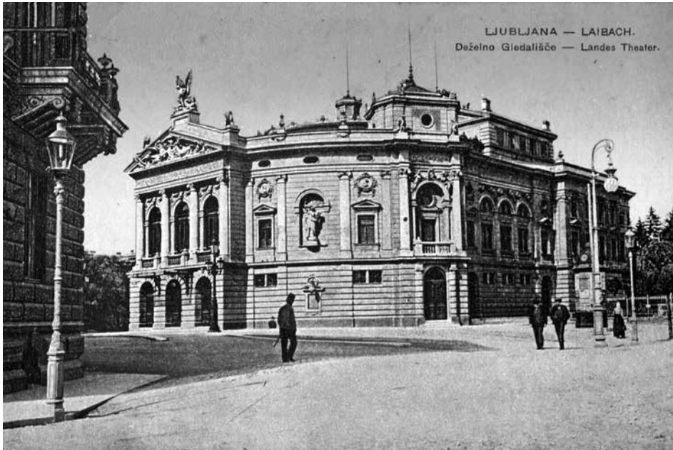
3. Razglednica z motivom Deželnega gledališča v Ljubljani